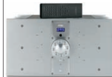
ИНТЕГРИРОВАННЫЙ УСИЛИТЕЛЬ Krell FBI $26 042 с. 73