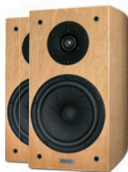
КОЛОНКИ Gamut L3 $8800 с. 71