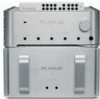
ПРЕДУСИЛИТЕЛЬ/ УСИЛИТЕЛЬ МОЩНОСТИ Plinius Tautoro/Sa-Ref $9791/$20 833