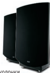
КОЛОНКИ Quad ESL 2805 $10 886 с. 72